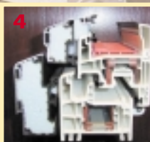
fot. 1 – Budowa domu pasywnego w Gdańsku Osowej fot. 2 – Ściana ocieplona 34 cm styropianem Termo-Lambda. Drzwi ciepłochronne firmy Bertrand fot. 3 – Test szczelności budynku pasywnego – tzw. „blower door test” fot. 4 – Przekrój ramy i skrzydła okna Bertrand S 7000 IQ PASSIV

W drzwiach wejściowych lub oknie ustawia się urządzenie z dmuchawą, tzw. „blower door” (fot. 3). Urządzenie to wypompuje powietrze z wnętrza aż do uzyskania podciśnienia w wysokości 50 Pa. Wówczas mierzy się strumień powietrza przepływającego przez nieszczelności.