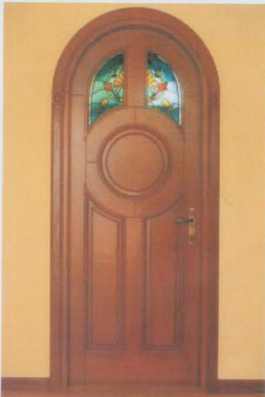
Drzwi z litego drewna – ponadczasowa elegancja

zania, które najlepiej spełniają ich potrzeby. Chętnie podejmujemy się trudnych zadań, takich jak wymiana stolarki w budynkach zabytkowych czy produkcja drzwi według wzoru wymyślonego przez klienta. Z naszych usług skorzystało wiele prestiżowych instytucji oraz osób znanych ze świata biznesu, polityki i mediów.